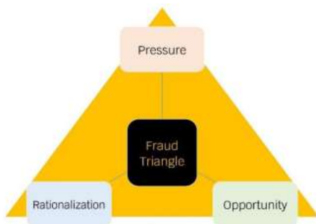
ทฤษฎี สามเหลี่ยมการทุจริต (Fraud Triangle)

องค์ประกอบหรือปัจจัยที่นำไปสู่ การทุจริต ประกอบด้วย Pressure/Incentive หรือแรงกดดันหรือแรงจูงใจ Opportunity หรือ โอกาสซึ่งเกิดจากช่องโหว่ของระบบต่าง ๆ คุณภาพการควบคุม กำกับควบคุมภายในของ องค์กรมีจุดอ่อน และ Rationalization หรือ การหาเหตุผลสนับสนุนการกระทำตามทฤษฎี สามเหลี่ยมการทุจริต (Fraud Triangle)